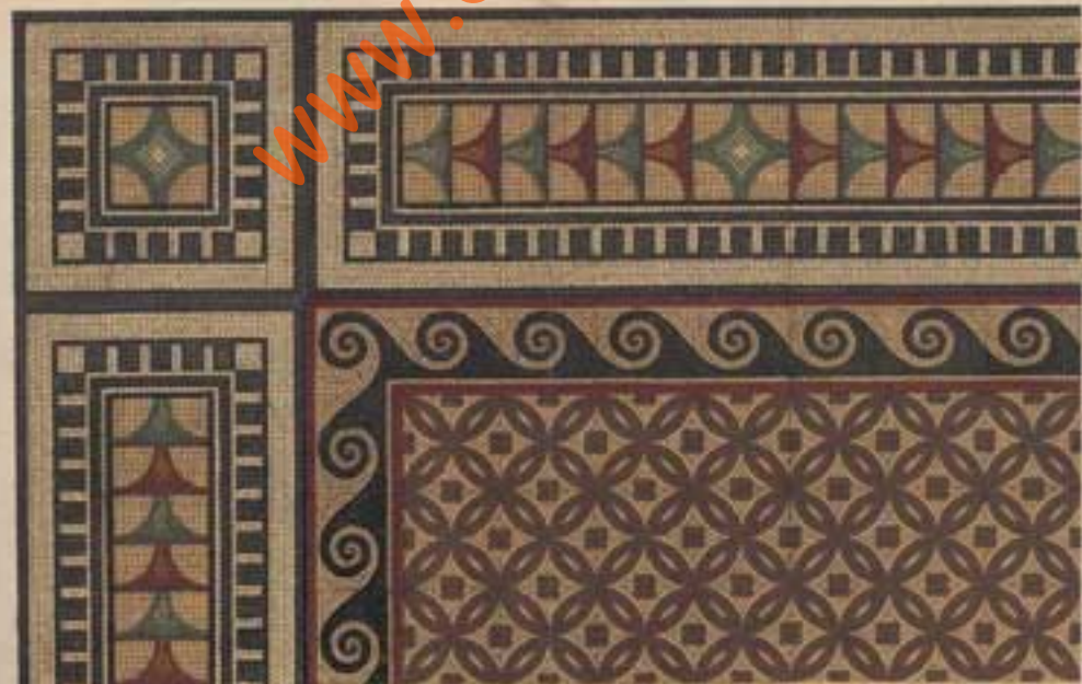
Preis 20' 185 Platten 20' 188. Preis 20' 189.