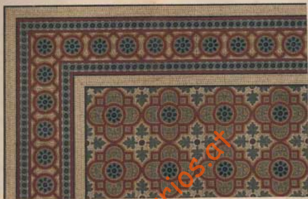
Preis 20' 227 Platten 24' 186. Preis 20' 187.